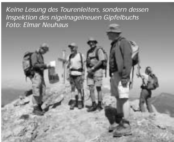
Keine Lesung des Tourenleiters, sondern dessen Inspektion des nigel-nagel-neuen Gipfelbuchs

Wald, mit einem Parcours, der einmal flach, einmal steil, breit und eng, gepflegt und manchmal etwas landwirtschaftlich ist – in einem Wort: abwechslungsreich. Der Tourenleiter legt ein züiges Tempo vor, erlaubt aber Ingo S. vorauszuweilen. Dieser nutzt wohl seinen Pensionisten-Status, um für die Olympischen Spiele zu trainieren?!?