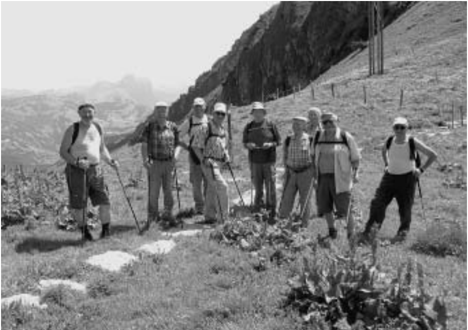
Gruppe B im Furggeli

Ein fantastischer Tag, den Organisatoren gebührt herzlicher Dank! ho