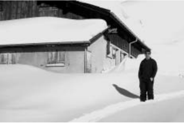
Samstag, 22. März 2008, 07.15 Uhr