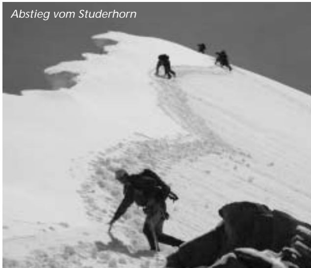
Abstieg vom Studerhorn