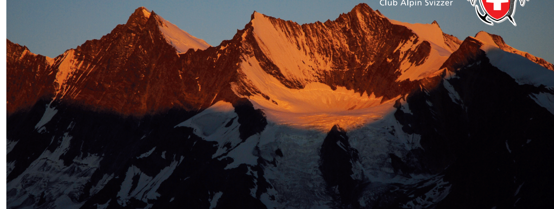
(Panorama vor der Weissmieshütte am frühen Morgen)